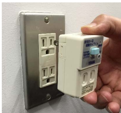
壁のコンセントに挿します