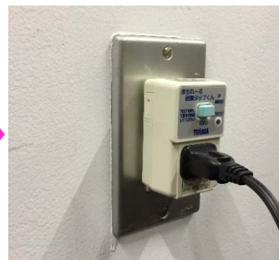
使用する機器の プラグを挿したら完了！