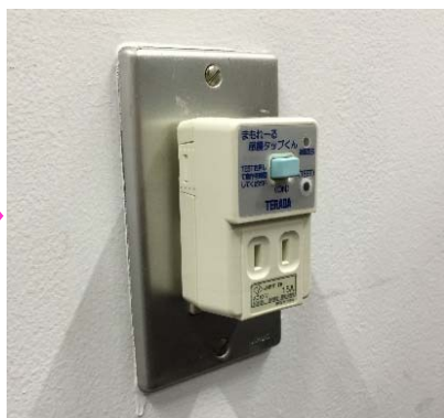
コンセントに挿した状態